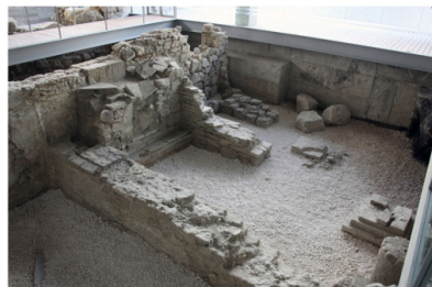
Restos arqueológicos de época romana en la Casa de la Juventud.

En su interior se pueden visitar restos de época romana. Próximo al conjunto se localiza la plaza del Hospitalillo, haciendo referencia al Antiguo Hospital de Santa María de la Piedad, construido en el s. XV, del que sólo se conserva su portada mudéjar.