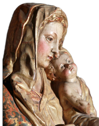
Virgen de la Piña. Juan Bautista Vázquez, El Viejo. Año 1577. Parroquia de la Oliva

Comenzamos en la plaza de España , antiguo prado situado junto a la Puerta de Sevilla. Ya intramuros, enfilamos el decumano máximo de la ciudad romana, que la cruzaba de este a oeste. Aquí encontramos el Convento de la Monjas Concepcionistas y su templo, del s. XVI, con una interesantísima portada tallada en piedra. Junto a ésta, la calle de las Monjas , en la que se aprecian los arbotantes que sostienen la bóveda de la iglesia. Seguimos hasta el cruce con Cala de Vargas, el cardo máximo , que cruzaba de norte a sur. En su intersección se encuentra la plaza Rector Merina, posible lugar del foro romano. Aquí destaca, por su majestuosidad, la Parroquia de la Oliva , construida a partir del s. XIII y con reformas posteriores, y su torre, la Giraldilla. Frente a la iglesia encontramos la Cilla del Cabildo , de fachada renacentista. Estuvo en uso hasta el s. XIX, momento en que se trasladó a la céntrica Plaza de España.