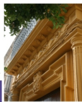
Détail de la façade d'une demeure seigneuriale dans la rue Corredera