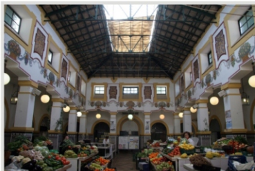
A l'intérieur du marché couvert, 1932

Nous commençons par la plaza de España, à côté de l' Eglise de Santa María de Jesús , qui faisait jadis partie de l'ancien couvent des Padres Terceros aujourd'hui disparu. D'ici nous montons la rue Corredera avec ses beaux exemples d' architecture seigneuriale des XVII et XVIII siècles. Plus loin dans la rue une architecture domestique qui a ses racines dans le passé agropastoral de la région prédomine. Plusieurs immeubles auparavant d'usage agricole en sont témoin, tel que le moulin à huile à l'angle avec la rue Chamorro.