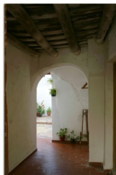
Cour typique d'une maison lebrijane