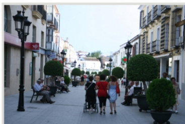
La rue Arcos est le centre commercial de la ville et la zone piétonne est un lieu de promenade et de détente pour les habitants

D'ici nous suivons les rue San Antonio et Cisne et débouchons sur le marché couvert , le coeur commerciale de la ville et le centre le plus animé. Le marché est un des plus beaux exemples régionaux de son genre, plein de vie et de couleurs et toujours en usage. Le marché et la rue piétonne Arcos qui le rejoint forment le lieu principale de passage et de rencontre des citadins de Lebrija. La rue Arcos donne sur la plaza de España à son extrémité nord, point où notre promenade se termine.