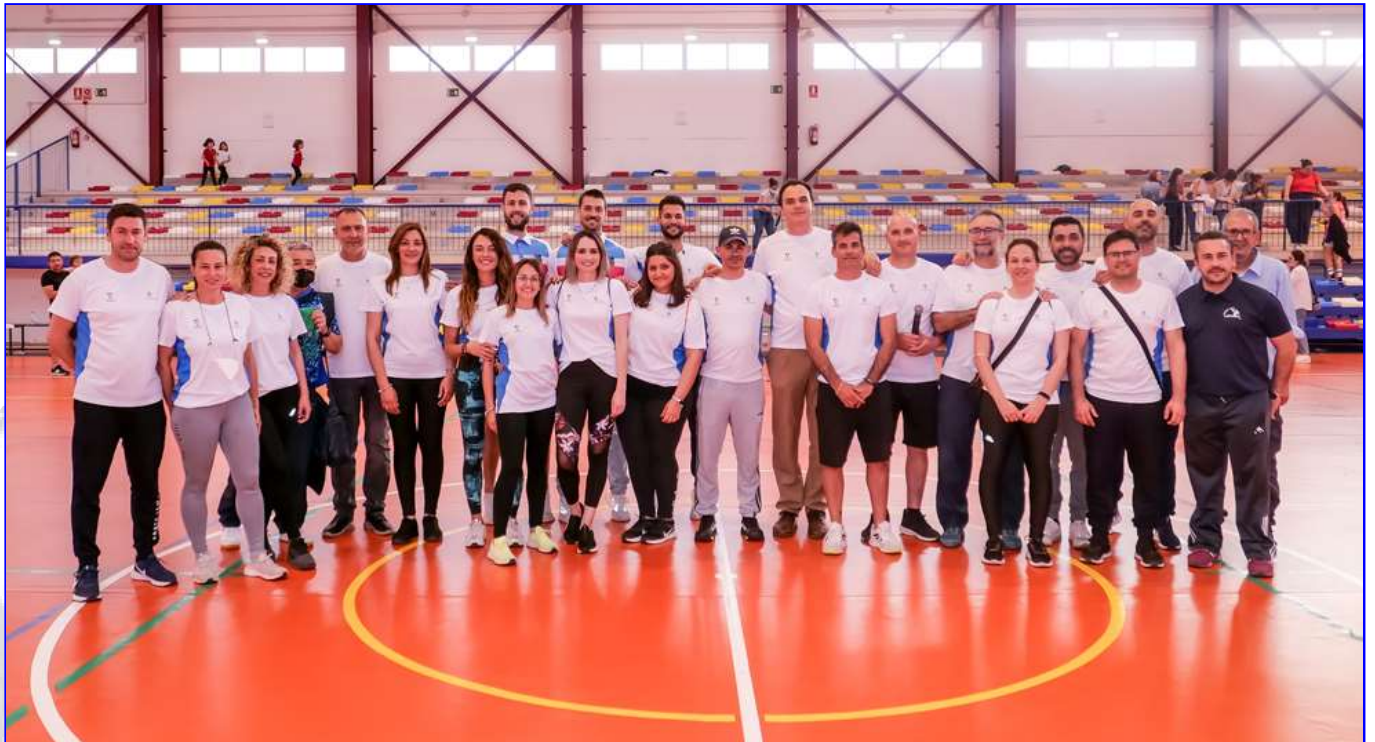
Monitores de las Escuelas Deportivas Municipales 2021/22