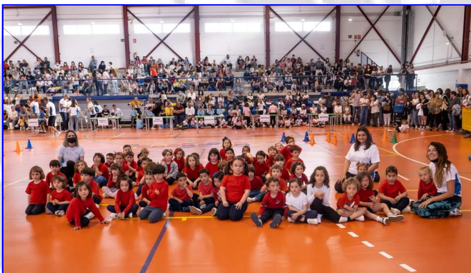
Escuela Deportiva de Psicomotricidad