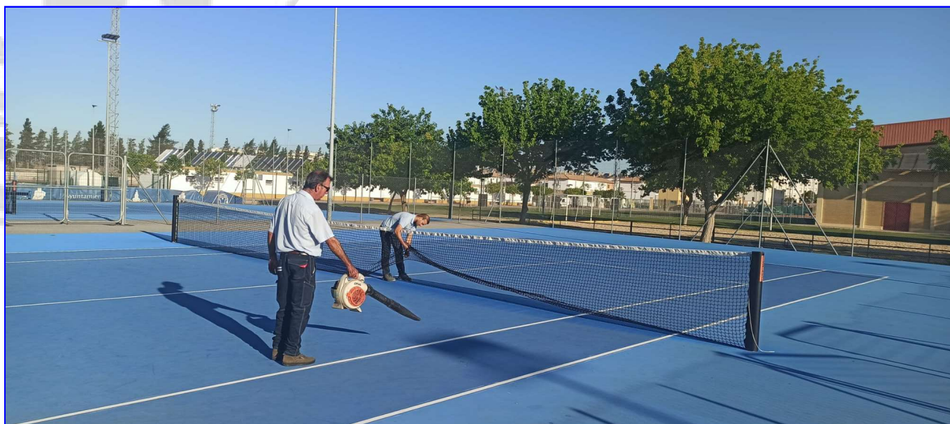
Limpieza y reparaciones continuas de las instalaciones deportivas municipales