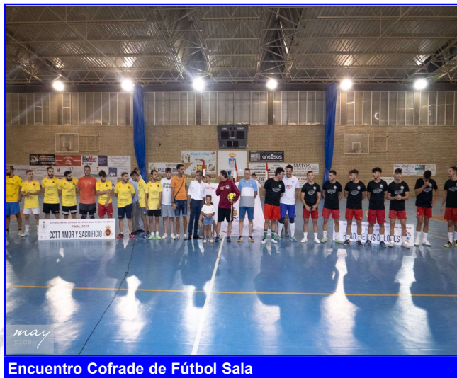
Encuentro Cofrade de Fútbol Sala