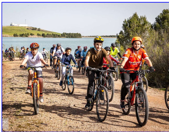
Día de la Bici - Marcha a la Balsa de Melendo