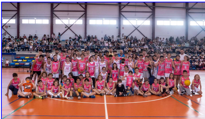
Escuela Deportiva de Baloncesto