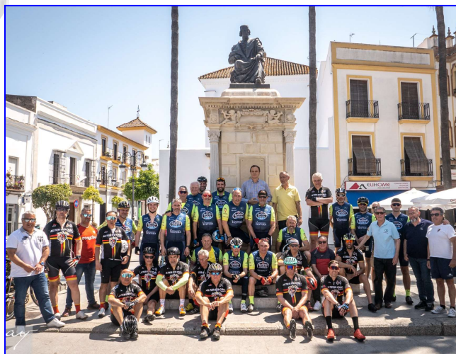
Ruta Nebricense en bicicleta