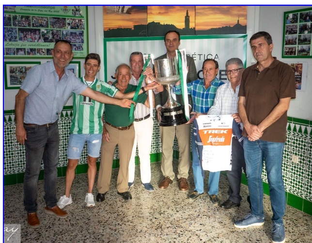
Copa del Rey en la Peña Bética de Lebrija