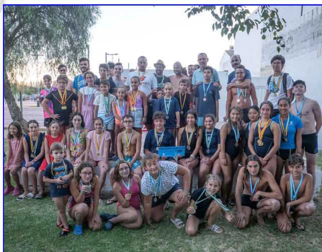
Campeonato Local de Natación