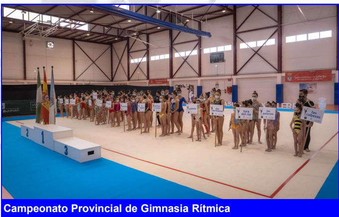
Campeonato Provincial de Gimnasia Rítmica