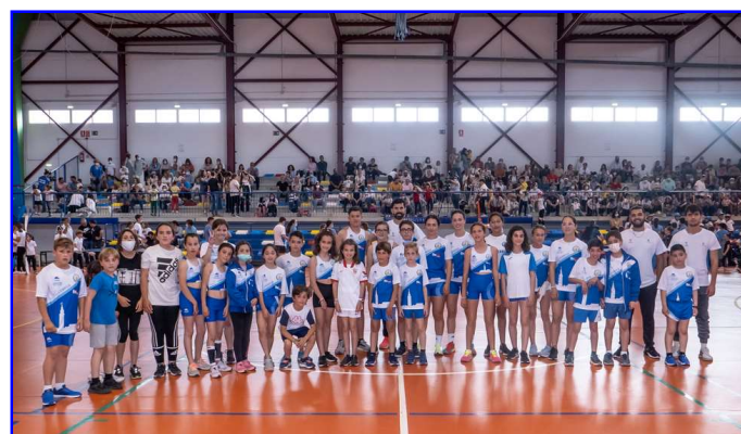
Escuela Deportiva de Atletismo