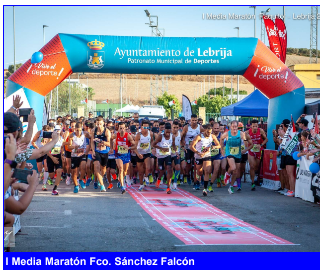
I Media Maratón Fco. Sánchez Falcón