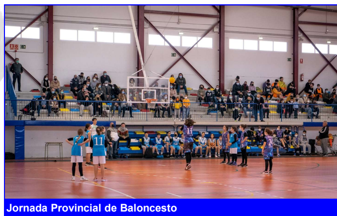
Jornada Provincial de Baloncesto