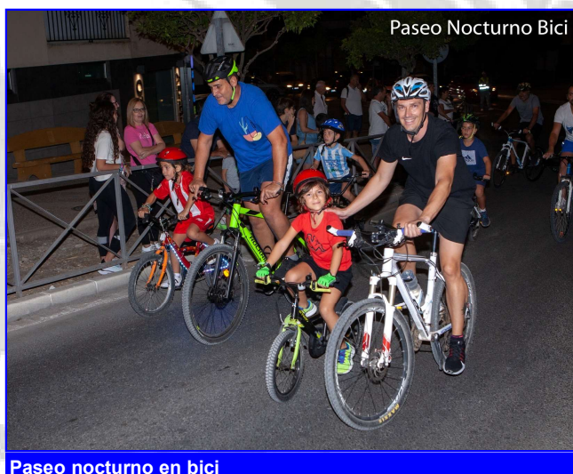
Paseo nocturno en bici