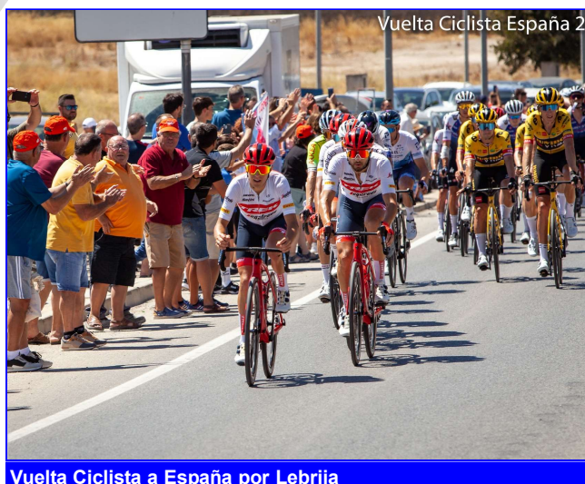
Vuelta Ciclista a España por Lebrija