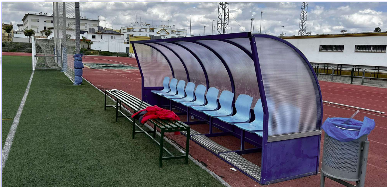
Arreglo de banquillos del Campo de Fútbol 11 del Polideportivo Municipal.

El Patronato Municipal de Deportes lleva a cabo, a través de su personal propio y el de las diferentes Áreas del Ayuntamiento de Lebrija (Delegación de Mantenimiento de la Ciudad, Delegación de Obras y Urbanismo, etc.), obras y mejoras para mantener las I.D.M. en el mejor estado de conservación posible. Diariamente se llevan a cabo todas aquellas operaciones de mantenimiento de las Instalaciones Deportivas Municipales como son limpieza, reparaciones, averías, soldaduras, pintura, fontanería, electricidad, etc.