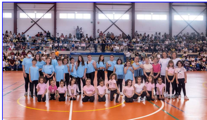
Escuela Deportiva de Bailes Deportivos