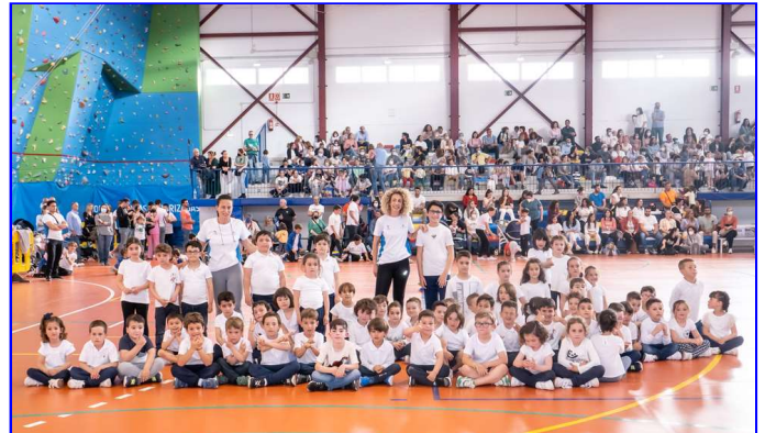
Escuela Deportiva de Predeporte