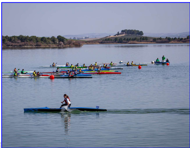
Campeonato de Andalucía de Piragüismo