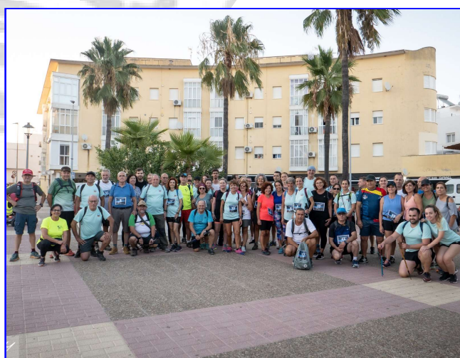
Marcha Nocturna CD Tirapalante