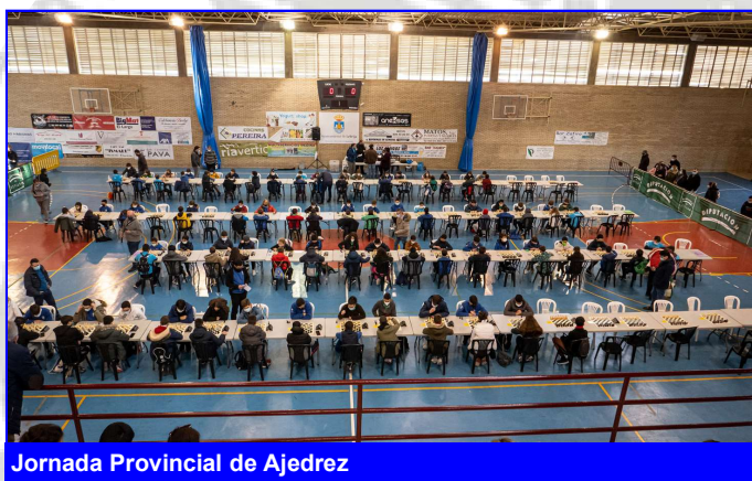
Jornada Provincial de Ajedrez