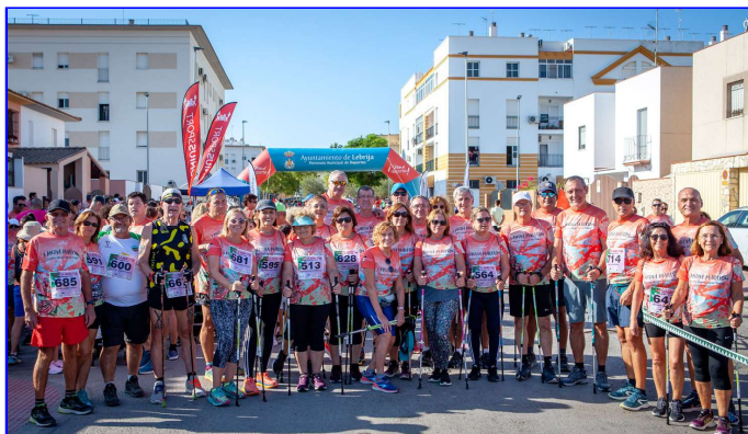
Escuela Deportiva de Marcha Nórdica