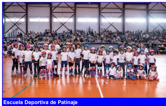
Escuela Deportiva de Patinaje