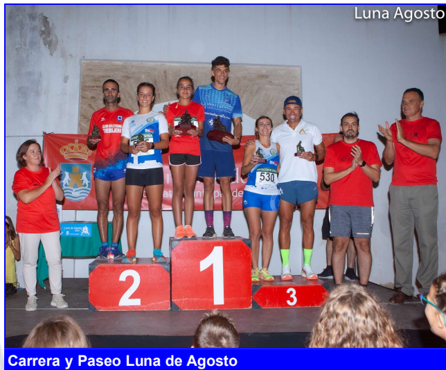
Carrera y Paseo Luna de Agosto