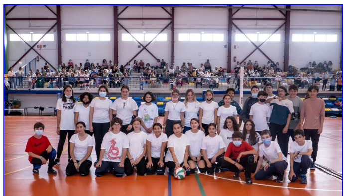
Escuela Deportiva de Voleibol