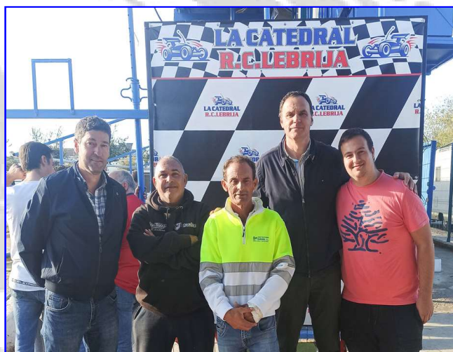
Campeonato de España de Radio Control