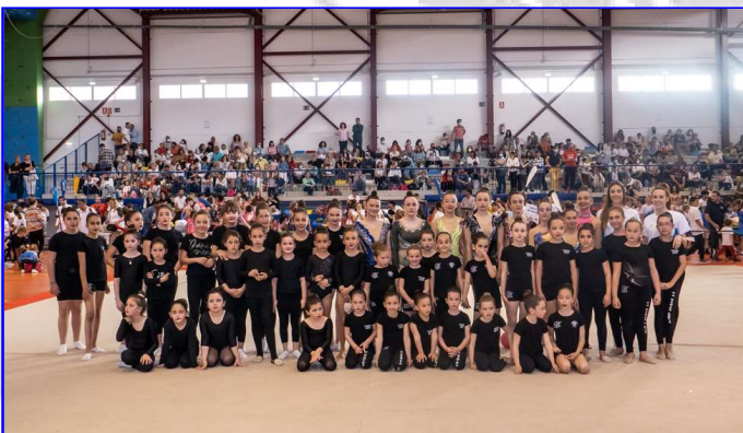
Escuela Deportiva de Gimnasia Rítmica