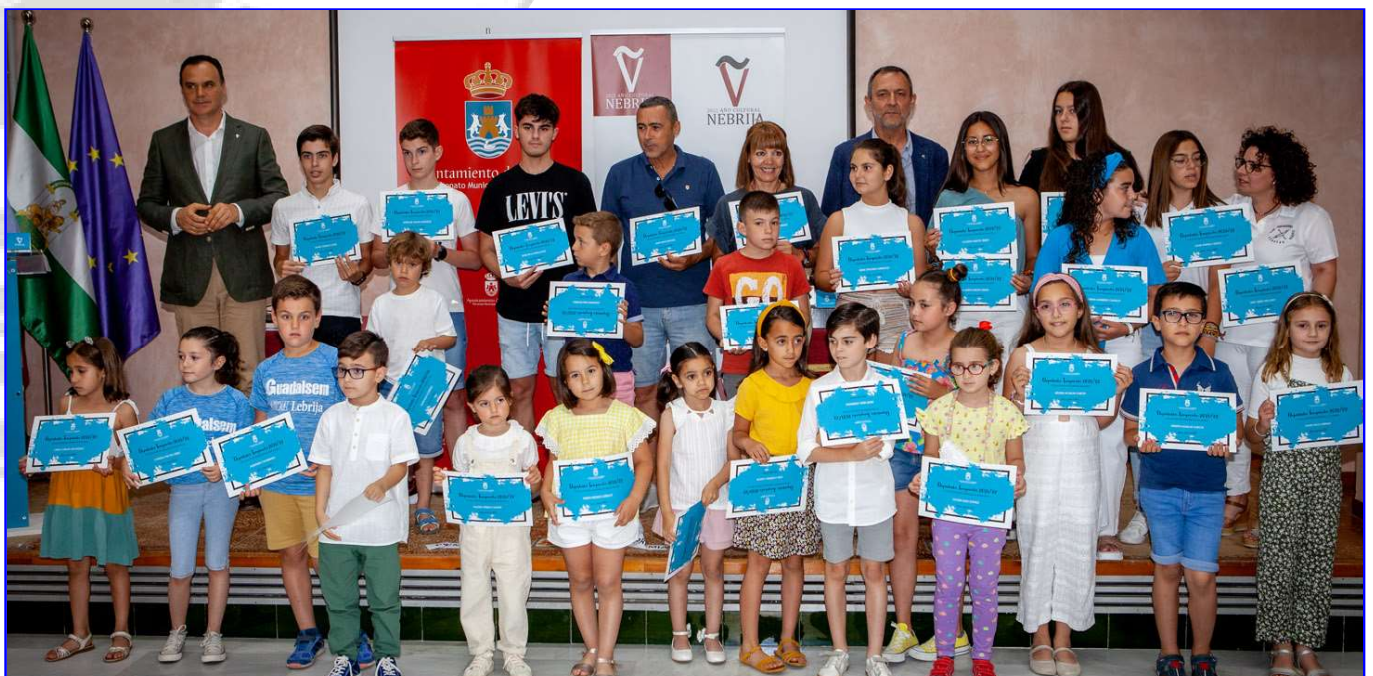
Deportistas de la temporada 2021/22 de Escuelas Deportivas Municipales