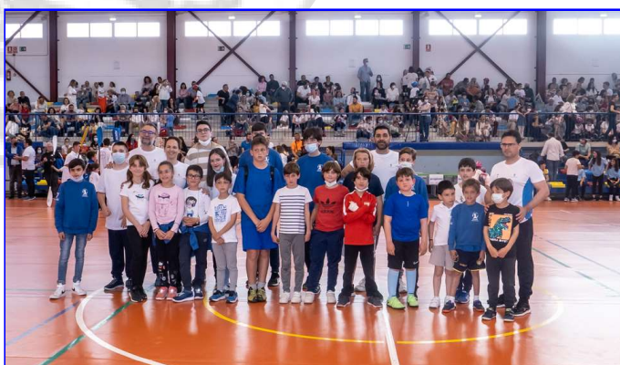
Escuela Deportiva de Ajedrez