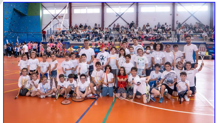
Escuela Deportiva de Tenis