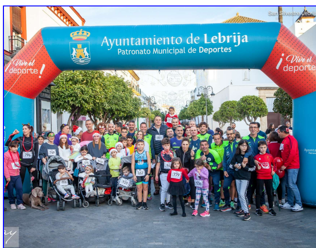
San Silvestre Lebrijana