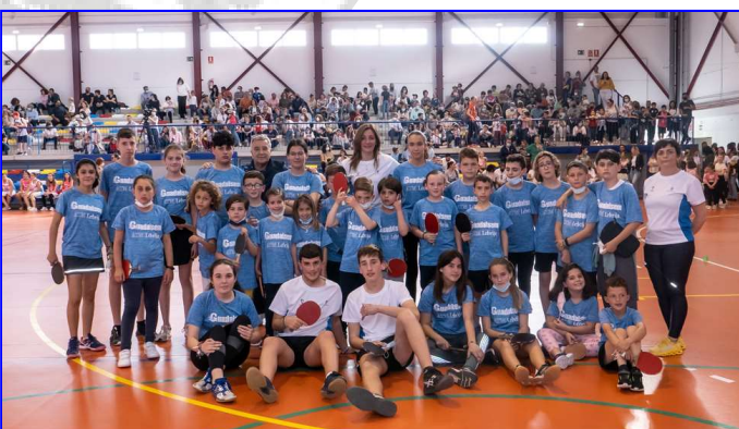
Escuela Deportiva de Tenis de Mesa