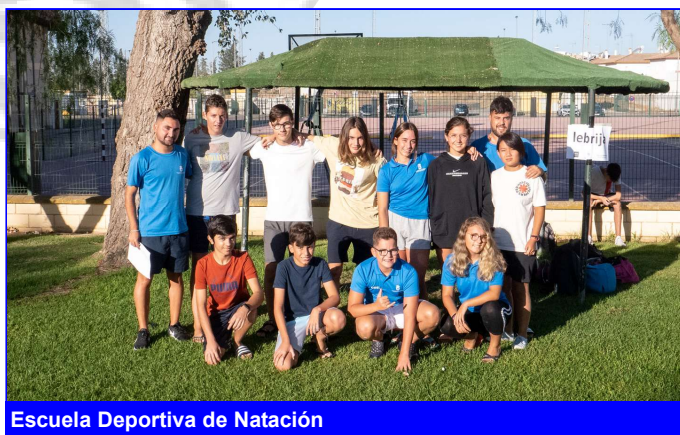
Escuela Deportiva de Natación