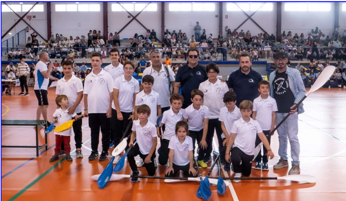
Escuela Deportiva de Piragüismo