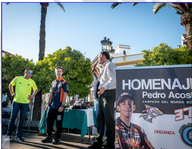
Recibimiento Campeón del Mundo Motociclismo Pedro Acosta