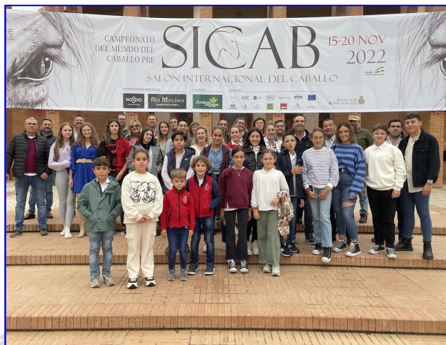
Visita Sicab del Club Hípico Lebrija