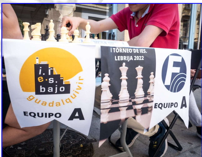
Torneo de Ajedrez de IES