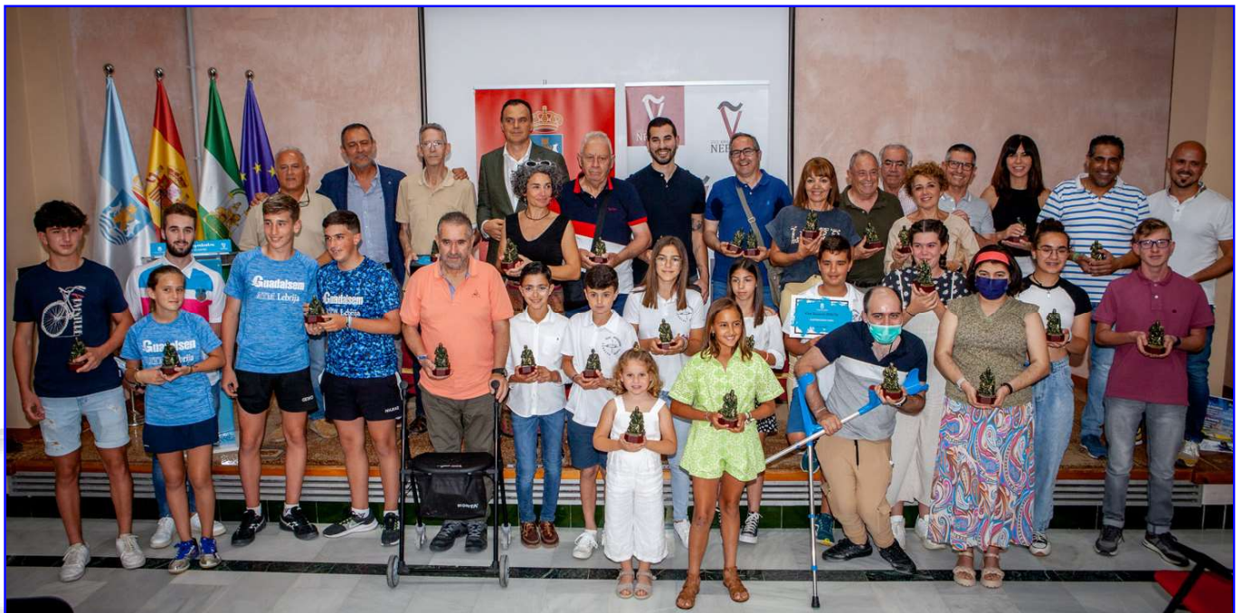
Deportistas de la temporada 2021/22 de Clubes Deportivos de Lebrija