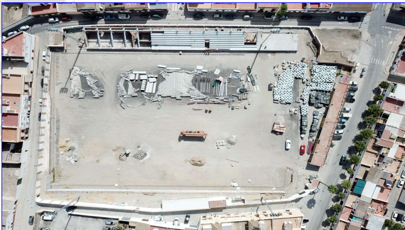
Estado de la obra de remodelación del Campo de Fútbol Municipal en el mes de octubre.

Gracias a la intervención, el Ayuntamiento ha creado un nuevo espacio público para el disfrute de la ciudadanía. Se construirá una nueva plaza pública entre las calles Alfarería y Salvador Allende, que permitirá mejorar el acceso al Campo de Fútbol Municipal.