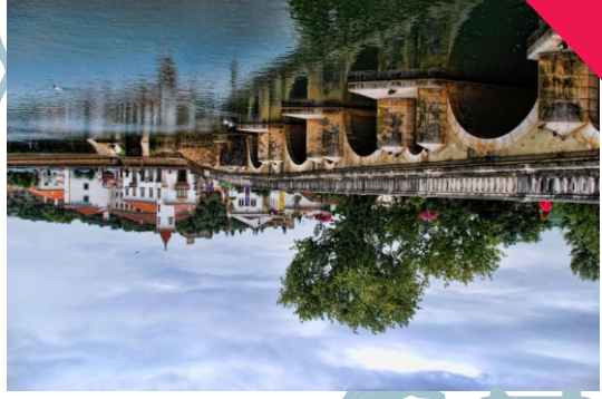
Puente de TOMAR